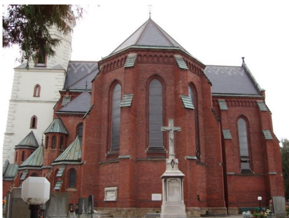
Obrázek 12 Kostel sv. Bartoloměje v Kravařích