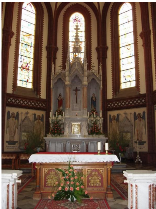
Obrázek 15 Hlavní oltář v kostele sv. Bartoloměje v Kravařích

do mramorových rámu. Každé zastavení bylo podepřeno dvěma dórskými sloupy. 66